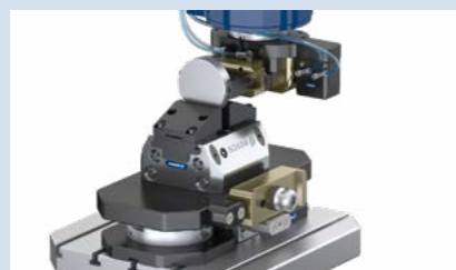
5 Automatisierte Werkstückbeladung.