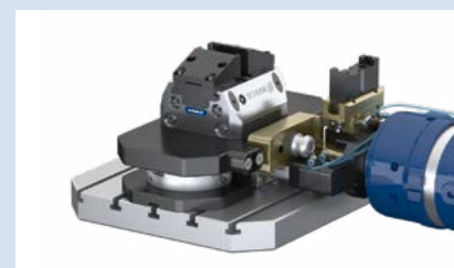
4 Roboter fährt. Spannstation verriegeln.