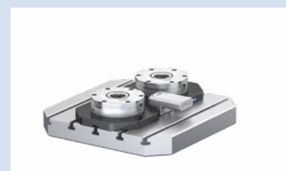
1 VERO-S NSL3 200 mit Medienkupplung.