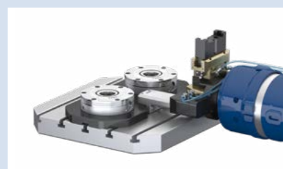
2 Spannstation öffnen über Kupplungsrippel.