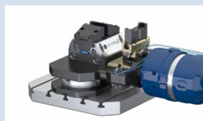
3 Beladung Spannstation. Spannmittel öffnen.